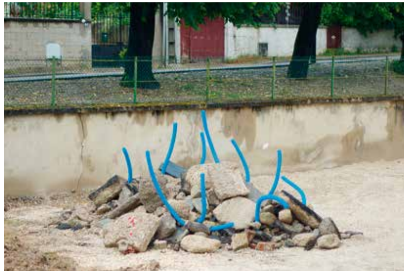
Laurent Lacotte, Bouquet de chantier, 2016 – Tujaux de construction en plastiques trouvés sur un chantier et réagencés sur tas de pierre et gravas, Migennes.